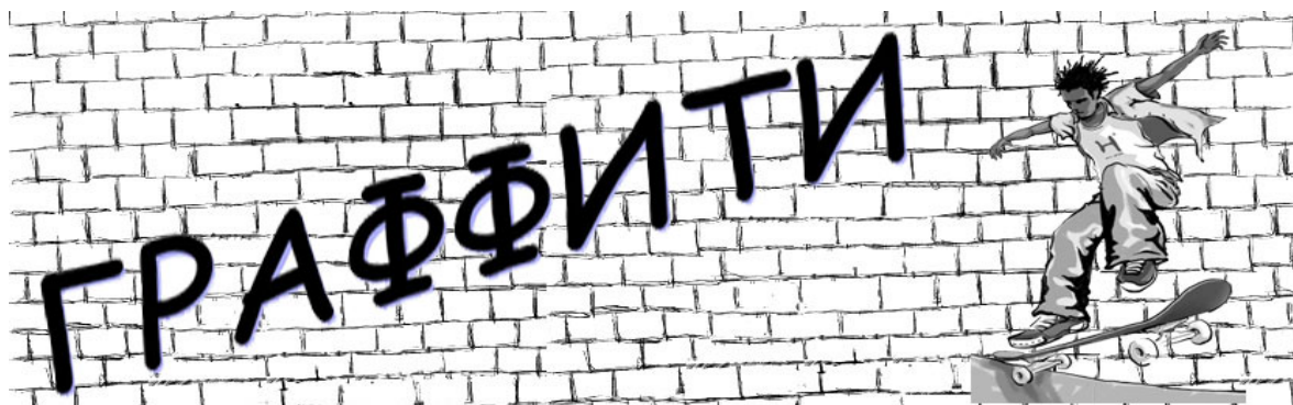
Проект ВОО «Молодая Гвардия Единой России»